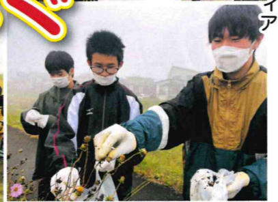
コスモス種摘みボランティア